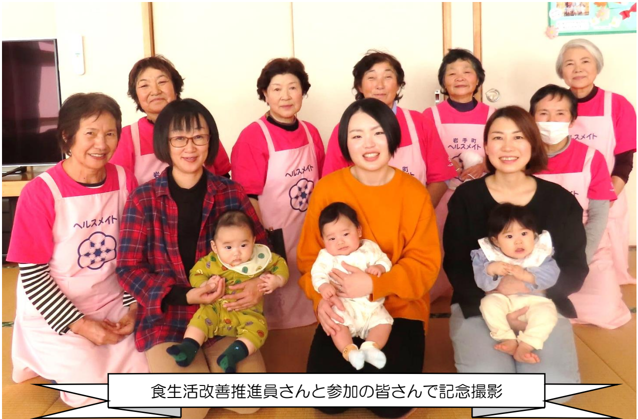
食生活改善推進員さんと参加の皆さんで記念撮影