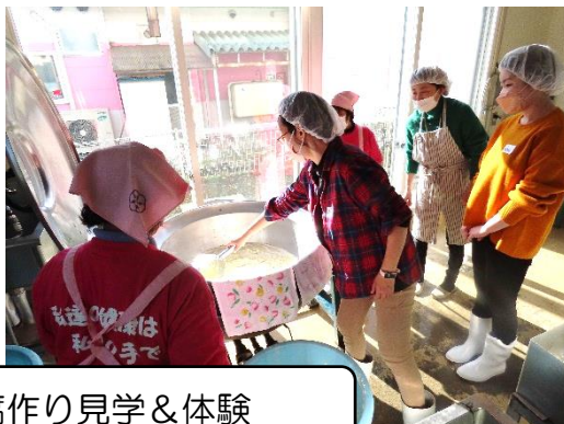
豆腐作り見学&体験